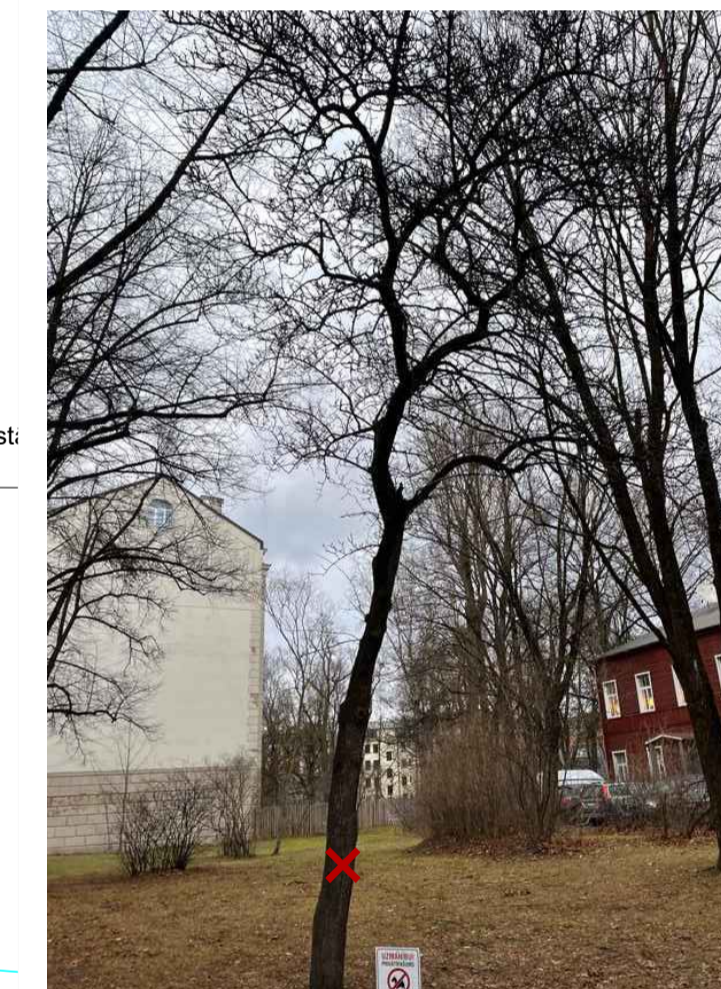
SKATS NR. 2