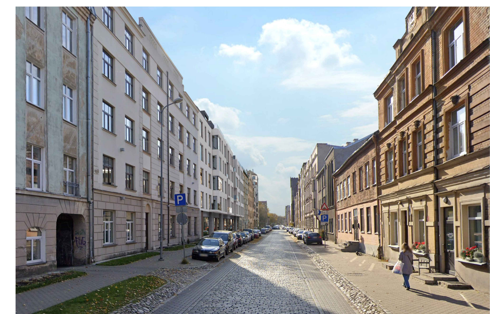
SKATS NO IERĒDŅU IELAS IELAS