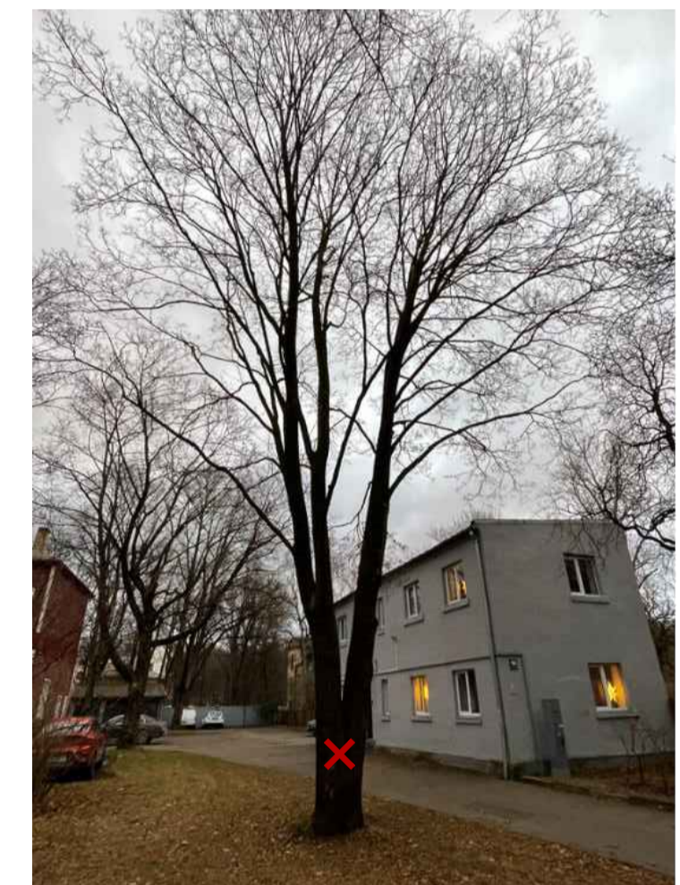
SKATS NR. 3