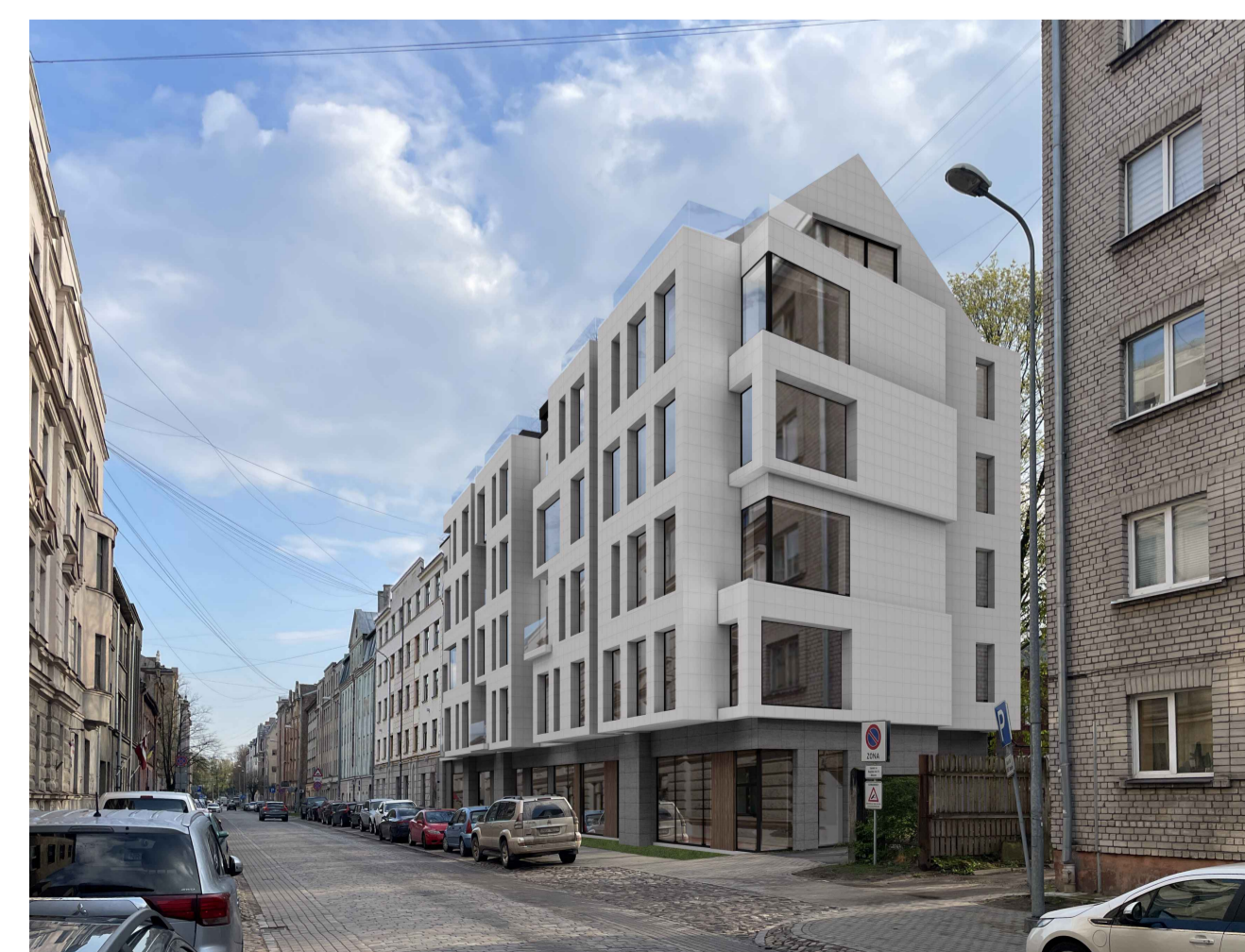
PLĀNOTĀS DZĪVOJAMO ĒKU APBŪVES VIZUALIZĀCIJAS SKATS NO ZIRŅU IELAS