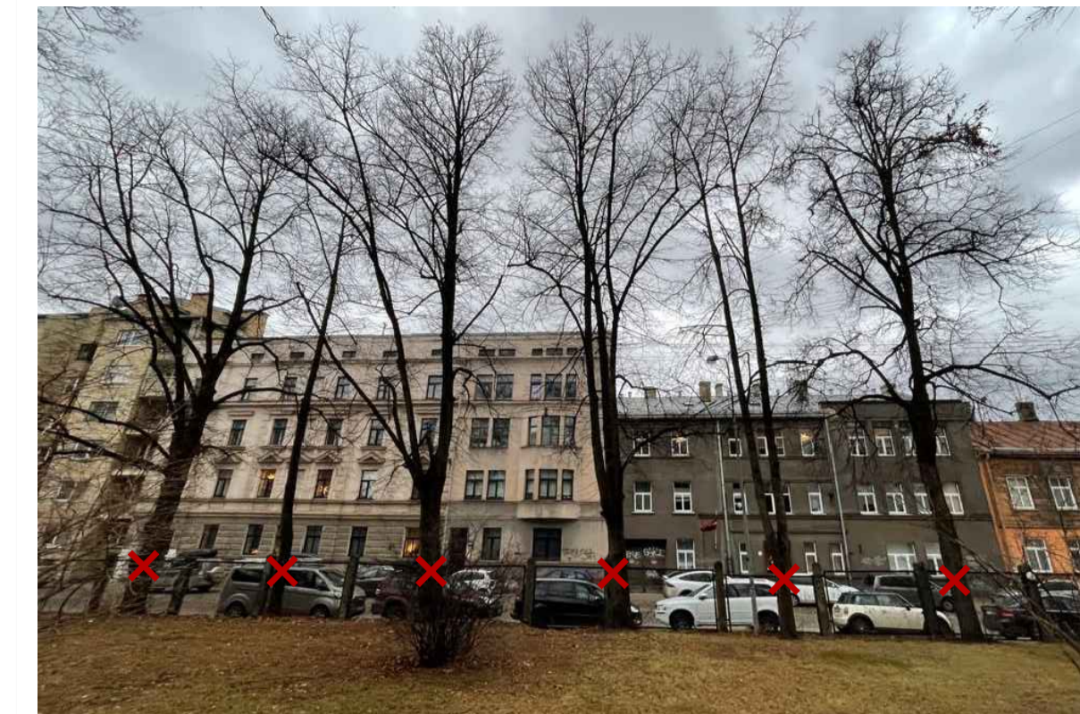
SKATS NR. 1